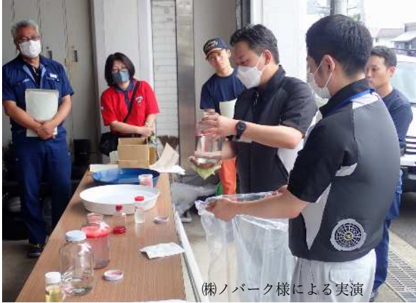
(株)ノパーク様による実演